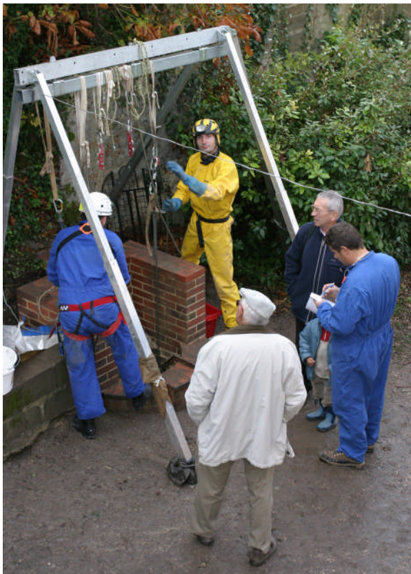
Portique installé au-dessus du Puits Bouillant.

Ici un module de 2 m