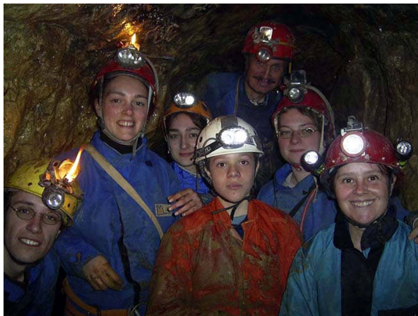
Sortie « Jeunes » à Puits Bouillant (Yonne) le 8 avril