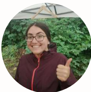
Lucie - La Musaraigne