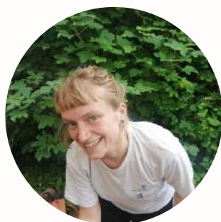
Zoé - GSD