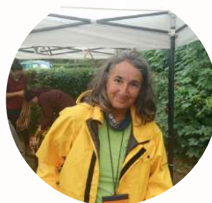
Régine - La Musaraigne